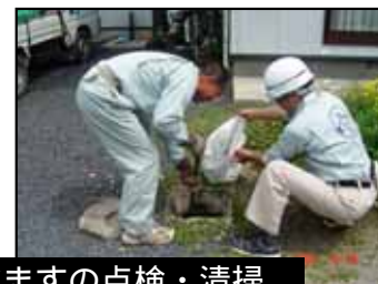
排水ますの点検・清掃