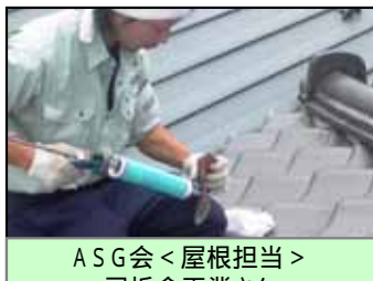
ASG会<屋根担当> 司板金工業さん