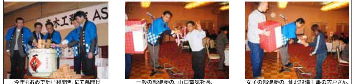
今年もおめでたく「鏡開き」にて幕開け