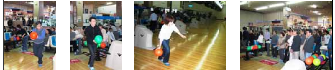
「ストライク!」「残念ガーター!」 いずれも劣らず 迷プレー 好プレー

1月27日(土)、第20回ASG会会長杯争奪新春ボーリング大会が古川トップボウルにて行われ、日頃の運動不足を解消するべく全員が大奮闘。終了後引き続き表彰式を兼ねた第21回ASG会新年会が、グランド平成にて開催されのべ総勢100名を超す参加者の下、今年も盛んに楽しく賑やかな会となりました。参加者の皆様には心より御礼申し上げます。来年も又是是非おまちしております。