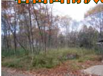
秋も深まり落葉が始まった「岩出山南沢」の建設地。