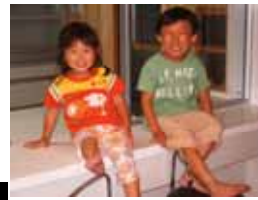
「ボクunchi」のボクと 妹のみいちゃん