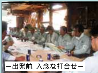
ー出発前、入念な打合せー