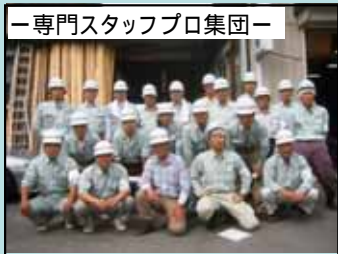
ー専門スタッフプロ集団ー