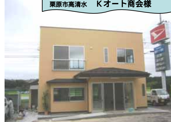
- 事務所新築工事 -